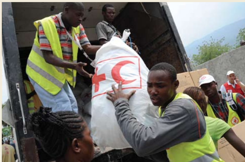
Los voluntarios de la Cruz Roja descargan y distribuyen bolsas repletas de suministros de socorro para familias que ahora viven en asentamientos cerca de Centreville, un vecindario de Puerto Príncipe.

La Cruz Roja Americana suministró el 43 por ciento de los artículos que la red mundial de la Cruz Roja distribuyó en Haití. Puedes ver un video de las distribuciones de socorro de la Cruz Roja durante las primeras semanas posteriores a la catástrofe.